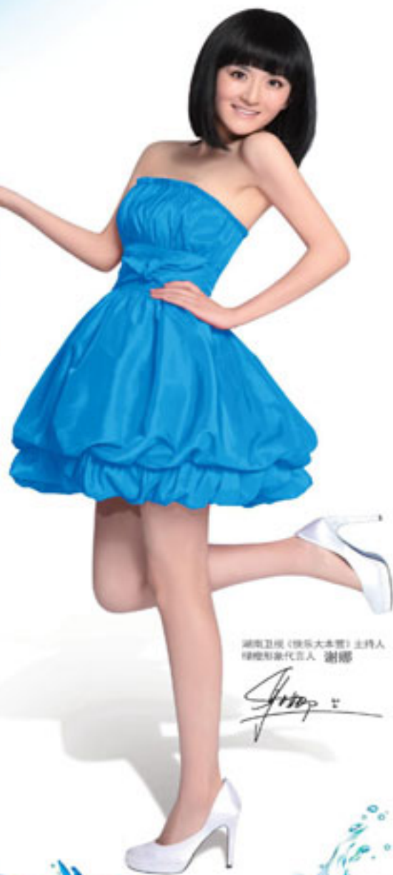
湖南卫视《快乐大本营》主持人 体操形象代言人 謝娜