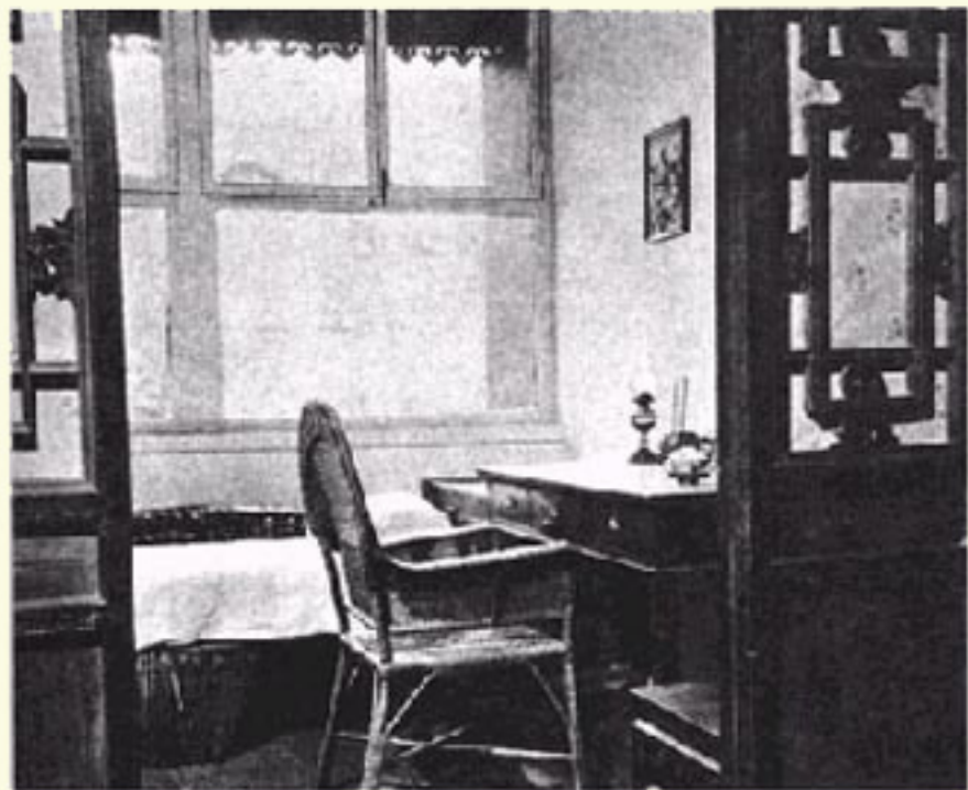
北京西三条寓所之“老虎尾巴”